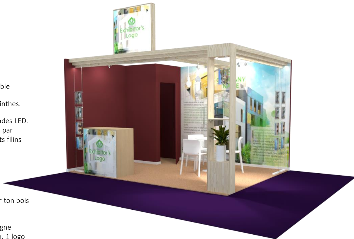
Exemple stand Design 12 m 2 Visuel non contractuel

+ 1 Accès plateforme comprenant : 10 badges nominatifs exposant, Invitation(s) personnalisée(s) avec suivi campagne, suivi en temps réel des prospects internet.