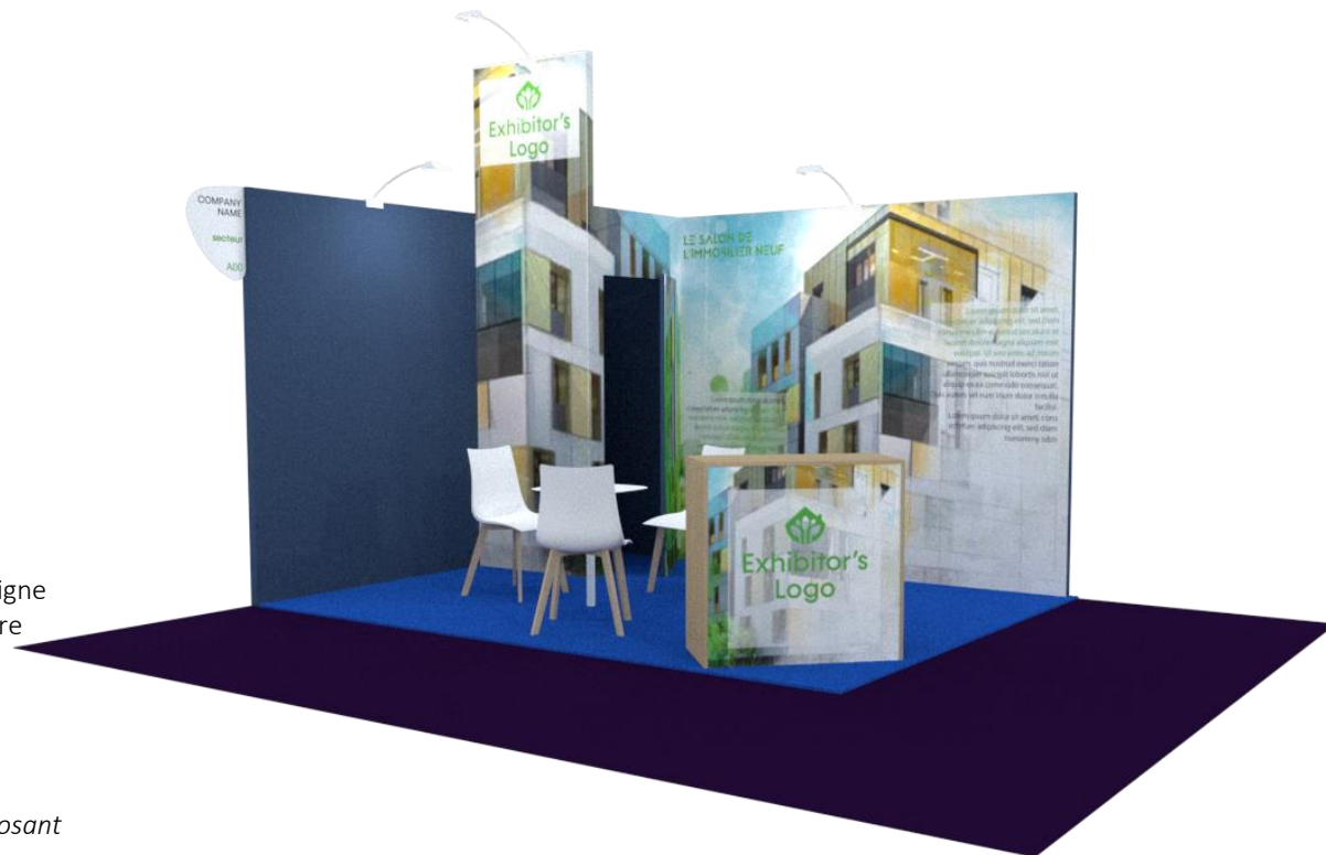
Exemple stand Premium 12 m 2 Visuel non contractuel

+ 1 Accès plateforme comprenant : 10 badges nominatifs exposant, Invitation(s) personnalisée(s) avec suivi campagne, suivi en temps réel des prospects internet.